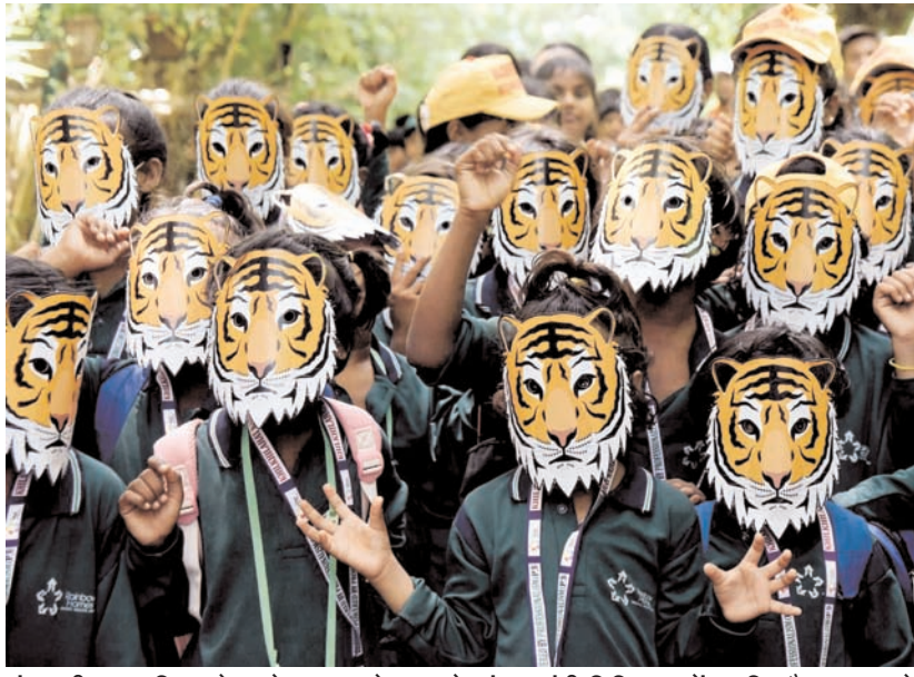
अंतरराष्ट्रीय बाघ दिवस से पहले गुफवार को पटना के संजय गांधी चिड़ियाघर में प्रकृति और बाघ बचाने के लिए जागरूकता मार्च में छात्र मार्च पहने हुए।