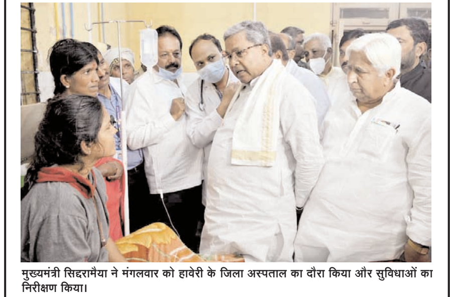
मुख्यमंत्री सिद्धरामैया ने मंगलवार को हावेरी के जिला अस्पताल का दौरा किया और सुविधाओं का निरीक्षण किया।