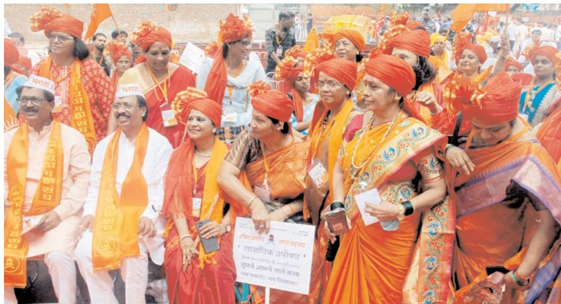
अखिल भारतीय मराठा महासंघ (एबीएमएम) के सदस्यों ने मंगलवार को नई दिल्ली में जंतर-मंतर पर आरक्षण की मांग को लेकर सरकार के खिलाफ विरोध रैली निकाली।