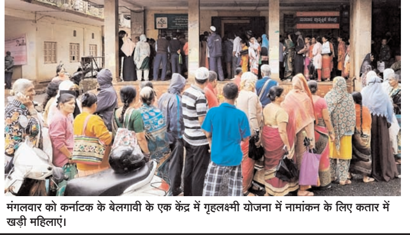
मंगलवार को कर्नाटक के बेलगावी के एक केंद्र में गृहलक्ष्मी योजना में नामांकन के लिए कतार में खड़ी महिलाएं।