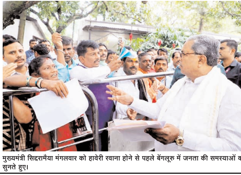
मुख्यमंत्री सिद्धरामैया मंगलवार को हावेरी रवाना होने से पहले बेंगलूर में जनता की समस्याओं को सुनते हुए।