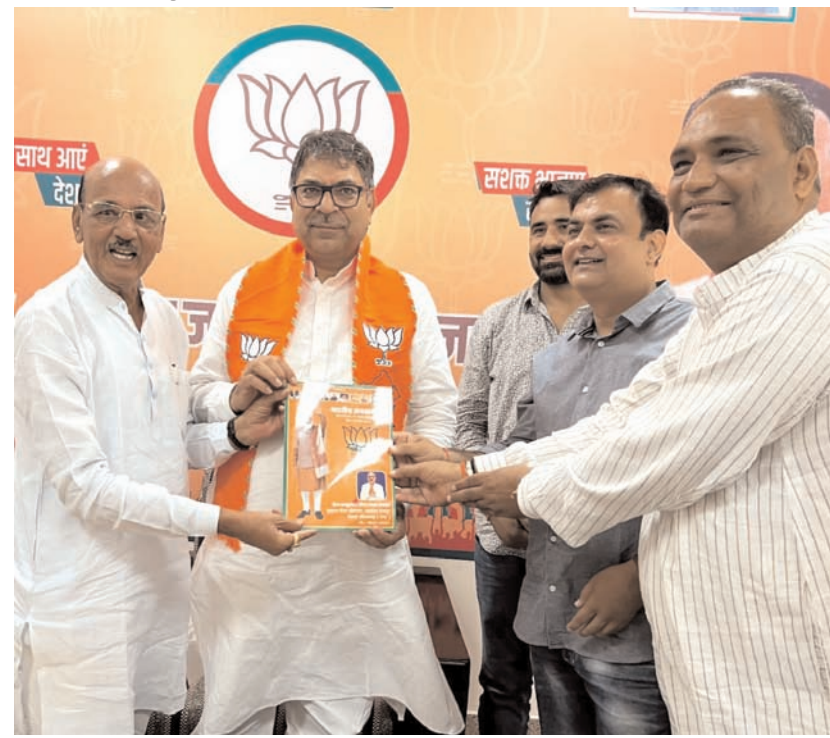
जयपुर में मंगलवार को जन संवाद केंद्र पर रंगर समाज के प्रतिनिधि मंडल से मुलाकात करते पूर्व भाजपा अध्यक्ष सतीश पूनिया।