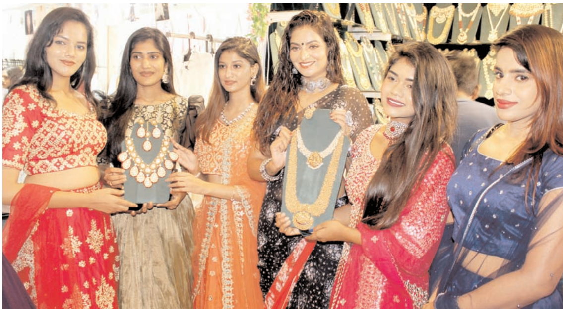
बुधवार को हैदराबाद में सूत्रा इंडियन फैशन-प्रदर्शनी के उद्घाटन के मौके पर फोटो खिचवाती मॉडल।