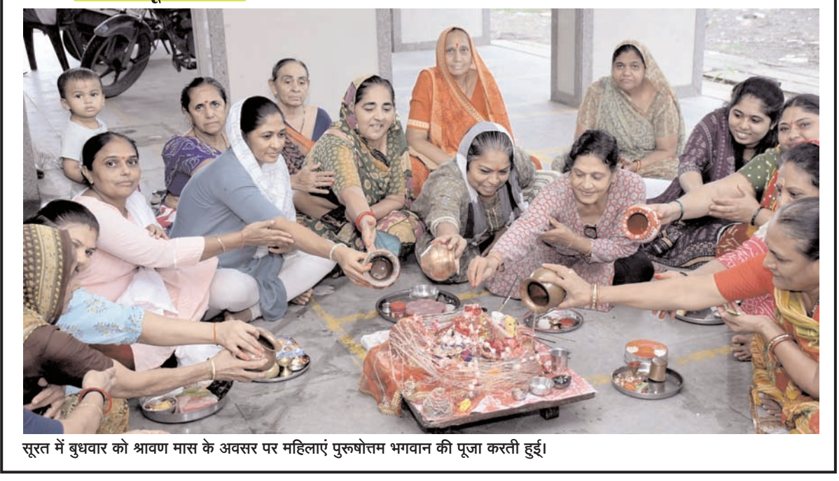
सूरत में बुधवार को श्रावण मास के अवसर पर महिलाएं पुरुषोत्तम भगवान की पूजा करती हुईं।