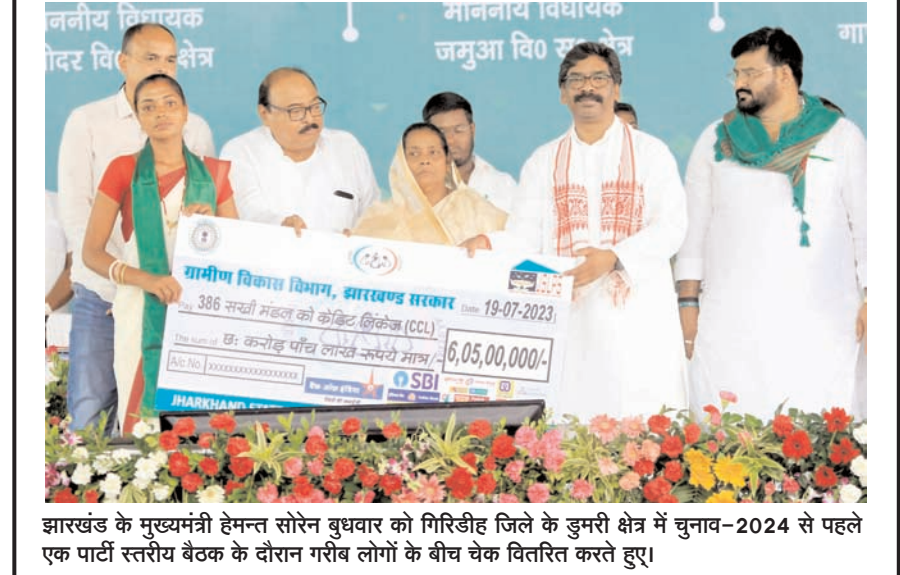
झारखंड के मुख्यमंत्री हेमन्त सोरेन बुधवार को गिरिडीह जिले के डुमरी क्षेत्र में चुनाव-2024 से पहले एक पार्टी स्तरीय बैठक के दौरान गरीब लोगों के बीच चेक वितरित करते हुए।