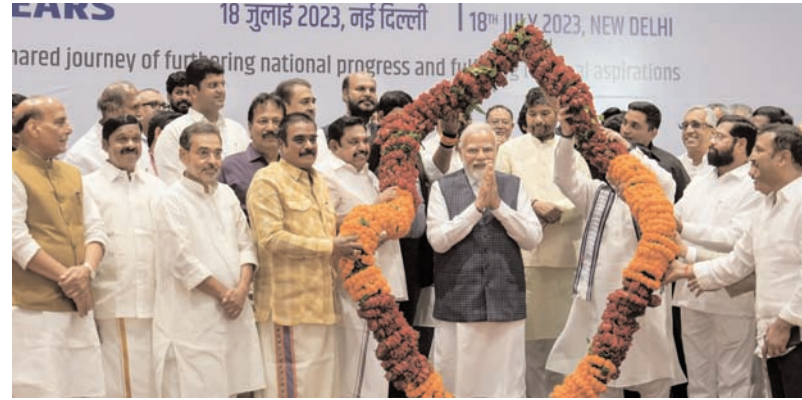
18 जुलाई 2023, नई दिल्ली | 18th JULY 2023, NEW DELHI Shared journey of furthering national progress and future aspirations

पार्टियों को आने वाले चुनाव में साधने की कोशिश कर रही है। कर्नाटक में हुई हार के बाद भाजपा ये समझ चुकी है कि उसे पार्टियों के साथ की जरूरत है। खासकर दक्षिण में जहां भाजपा उत्तर भारत के मुकाबले कमजोर है और क्षेत्रीय दल काफी दक्षिण में 130 लोकसभा सीटें हैं। बाजपा की मुख्य सहयोगी पार्टी एआईएडीएमके है जिसने 2019 के लोकसभा चुनाव में तमिनाडु में 39 सीटें जीती थीं। खबर है कि तेलंगाना में भाजपा टीडीपी के बीच गठबंधन को लेकर बातचीत चल रही है। भाजपा ने बीते लोकसभा चुनाव में खुद के दम पर 303 सीटें जीती थीं, भाजपा का वोट शेयर 37 फीसदी था। ऐसे में उसे आखिर गठबंधन की जरूरत क्यों है?